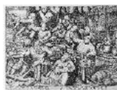
Cuisine des gras