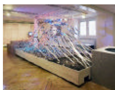
La lutte des gras et des maigres (Strauhof)