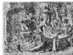
Cuisine des maigres