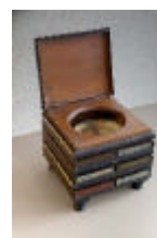
Toilettes pour un cabinet de lecture